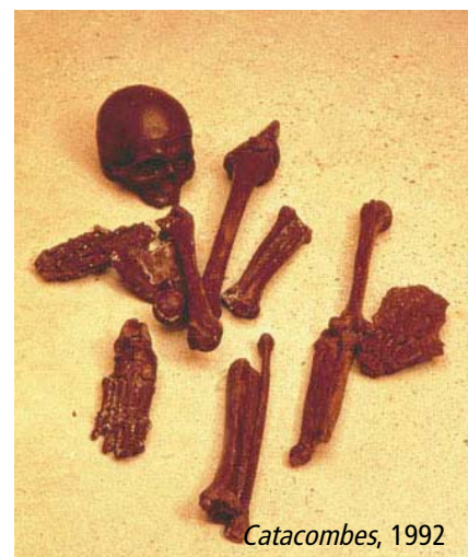
Catacombes , 1992

C'est le chocolat avec toutes ses connotations de denrée coloniale, produit de luxe réservé à une élite. Introduit en France par Marie-Thérèse d'Autriche, il a connu une grande vogue avant de tomber en défaveur. (En témoigne une lettre de Mme de Sévigné à sa fille : "Je peux vous dire ma chère enfant, que le chocolat n'est plus avec moi comme il l'était. La mode m'a entraînée comme elle le fait toujours. Tous ceux qui m'en disent du bien m'en disent du mal. On le maudit.") Malgré sa densité énergétique, il est toujours considéré comme une nourriture superflue, voire frivole. Catacombes était une création conçue spécialement pour une minuscule salle voûtée découverte par hasard dans