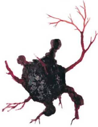
Metamorfosis 19, 2002

a d'ailleurs emplit l'espace de l'une des pages du livre de la répétition du mot vida , écrit à l'encre rouge, sur le mode all over, ne laissant à l'œil aucun répit. S'il parcourt celle-ci, le regard bute en fin de parcours sur le mot muerte , qui vient comme un rappel à la réalité inéluctable de notre finitude. Tout au long de cet ouvrage, il y va de tout un vocabulaire iconographique qui mêle toutes sortes d'images d'organes, de viscères, de corps et de fragments de corps à des figures aux allures de bronchioles, de ramures, voire d'éléments végétaux comme des feuilles ou des arbres. Autant de motifs aux couleurs rouge et noir, parfois hybrides, comme ces deux mains dont l'extrémité des doigts sont eux-mêmes de petites mains ou cette figure d'homme marchant dans le dos duquel pousse tout un jeu de branchages incongru. Ou bien encore ce troublant nuage sombre, en suspens dans l'espace, affublé d'une queue de radicelles rouge vif, dont l'aspect réfère à celui d'un terrible champignon. Si le corps est la figure référentielle de toute l'œuvre de Pérez, la vie et la mort en sont les corollaires naturels. Ils y sont intimement liés.