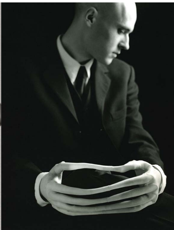
Javier Pérez, Autorretrato , 1993

Contact Presse : Sergine Gallenne sergine.com.frachn@orange.fr / 02.35.72.27.51