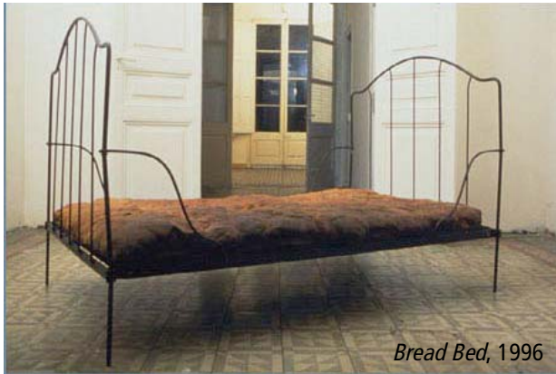
Bread Bed , 1996

Le grand pain en forme de matelas posé sur un cadre de lit métallique était au fond une manière assez élégante d'aborder divers sujets. Bread Bed a été conçu pour la première exposition d'art