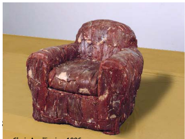
Chair Apollinaire, 1996

La Chair Apollinaire , conçue peu après Vanitas , n'a été exposée qu'en 1996 à Vienne, dans le cadre de Feed & Greed . C'est une armature en résine polyester qui reçoit le jour du vernissage, une garniture d'environ 70 kilos de bifteck. Le salage évite la décomposition qui signale la mort. La chair est conservée et neutralisée en même temps. Ces œuvres ne sont pas réalisées avec de la viande, comme